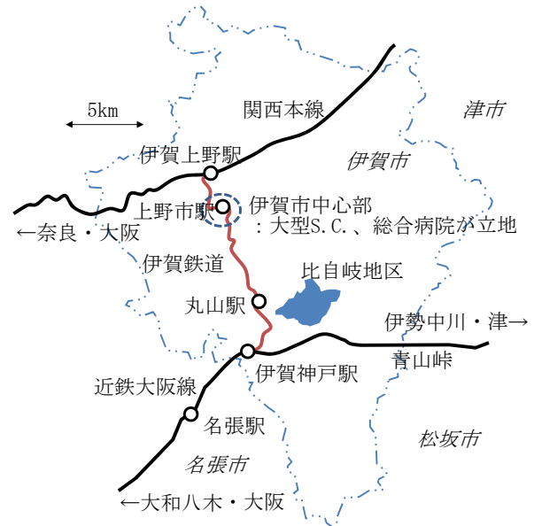
図-3 三重県伊賀市鉄道交通概要

このバスが目的地としている丸山駅の周辺は、田園地帯であり、地域住民は大型ショッピングセンターや総合病院の立地する伊賀市内中心部まで直接の運行を希望している(位置関係などは図-3を参照のこと)。